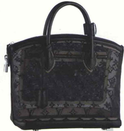
TRÈS CHIC LO STORICO MODELLO LOCKIT DI LOUIS VUITTON SI VESTE IN NERO PER LA BLACK CAPSULE COLLECTION: QUI, IN NYLON CON MONOGRAM RICAMATO (2.520 €).