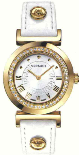
DA POLSO LOOK BIANCO E ORO PER VANITY CHRISTMAS EDITION DI VERSACE: SULLA CASSA IN IP ROSE GOLD, LA LUNETTA HA UN DIAMANTE E IL MOTIVO GRECA.