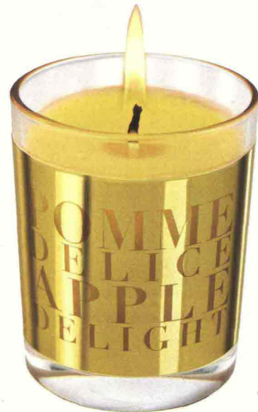
GOLOSA PERFETTA PER RISCALDARE UNA SERATA TRANQUILLA IN CASA LA CANDELA PROFUMATA DI MELA CANDIDA E VANIGLIA: È POMME DÉLICE DI YVES ROCHER (7,95 €).