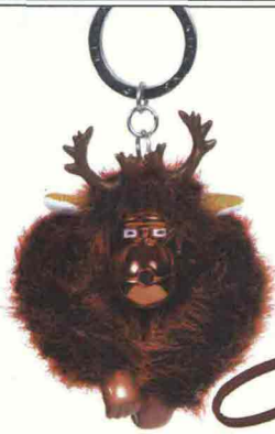
PORTAFORTUNA LA SCIMMIETTA CHE FIRMA LE COLLEZIONI DELLE BORSE KIPLING SCEGLIE UN'INEDITA VESTE DA RENNA (17,90 €).