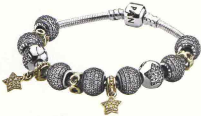
SPARKLING IN ARGENTO STERLING (59 €), I BRACCIALI DI PANDORA POSSONO ESSERE PERSONALIZZATI SCEGLIENDO I CHARMS, CON PAVÉ DI ZIRCONIA (DA 39 €).