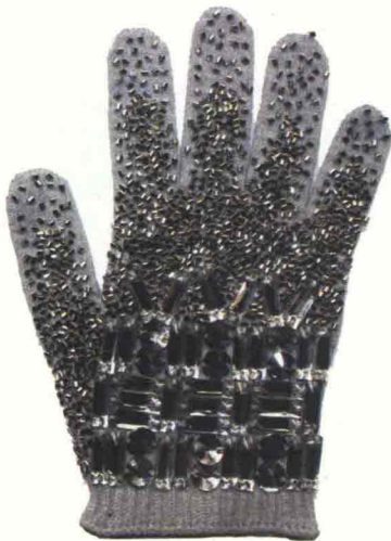
DA REGINA DELLE NEVI PER RIPARARSI DAL FREDDO E SENTIRSI UN PO' MAGICHE, I GUANTI IN LANA INDOSSANO UNA CORAZZA DI CRISTALLI COLOR GHIACCIO: LI FIRMA 28.5.