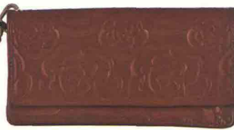
ROSE ROSSE LA POCHETTE DI TOSCA BLUSCEGLIE UN MOTIVO FLOREALE SULLA VERNICE PER IL COLORE PIÙ NATALIZIO CHE CI SIA. E SI PUÒ PORTARE AL POLSO (53 €).